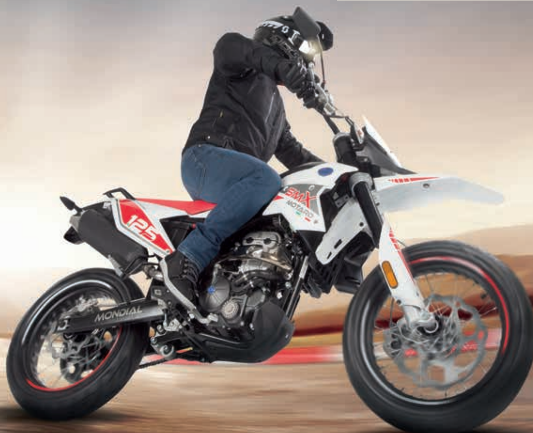
F.B Mondial SMX 125i Supermoto