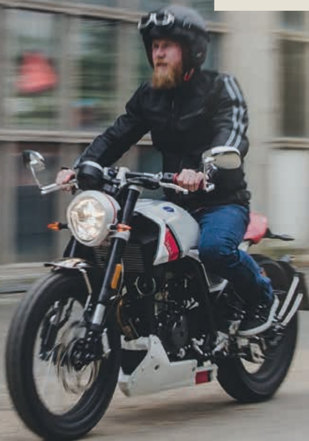
F.B Mondial HPS 125i